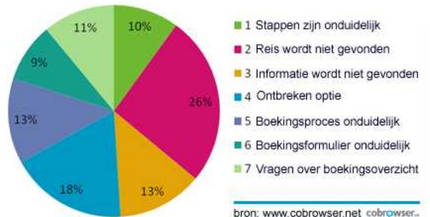
Fig. 1 Redenen voor een klant om af te haken tijdens het online boeken van een reis.

Chatten en cobrowsing ondersteunen het online proces, verbeteren de online dienstverlening en verhogen daardoor de conversie online.